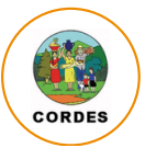
Asociación Fundación para la Cooperación y el Desarrollo Comunal de El Salvador