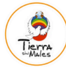
Tierra sin males