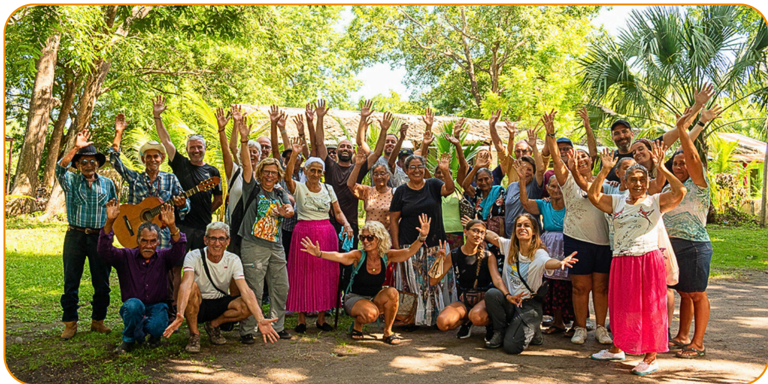
Un grupo de viajeros de Kareba Viatges y socios de la ONG visitan la Asociación Rural de la Tercera Edad (ARTE) y a las personas mayores apadrinadas en el bajo Lempa, en El Salvador.